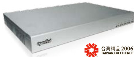
Openfind™ MAILGATES Appliance

Openfind MailGates Appliance 是一款結合郵件系統防護、內容過濾、政策稽核、統計報表與系統備援機制的全方位郵件防護閘道器。為提供更全面且完整的郵件安全防護機制，MailGates 重裝打造雙核心郵件防護系統，整合「內容過濾」與「行為分析」兩大防護機制，協助企業郵件防護再升級。MailGates 獨家自行研發的 Mail2000 MTA 核心，針對台灣地區郵件使用行為提供在地化的分析技術。此外，更每月自動偵測並蒐集分析全球 30 億封以上的信件樣本，不受限於其變化多端的樣貌，透過分析郵件發送行為即能有效阻攔任何語系的垃圾信，確保訊息溝通無國界。