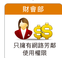
▲ OES 帳號權限管理示意圖